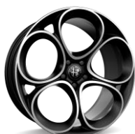
Speciale 8,5 x 20