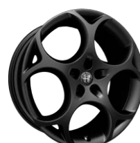
Turismo 8,5 x 21