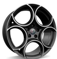
Classico 8,0 x 19